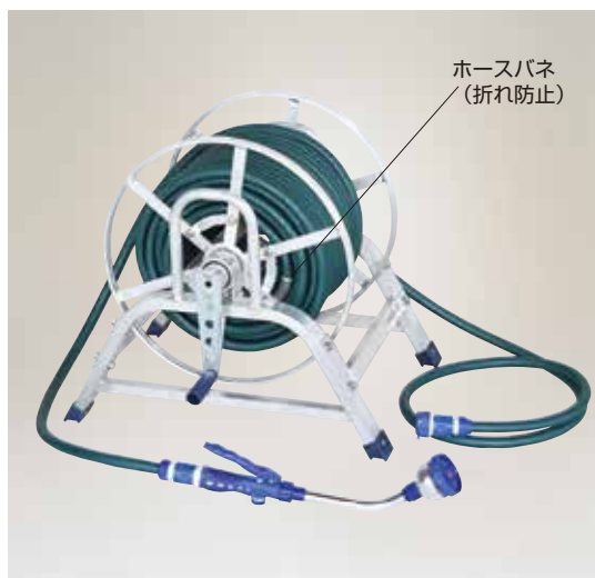
ホースバネ (折れ防止)