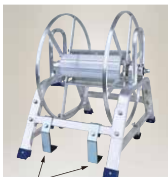
フック金具 写真はDR-100F

●フック付きですから軽トラックのアオリに取付けできます。またアオリ用フックを取付けたままでも地面に設置できますから便利です。