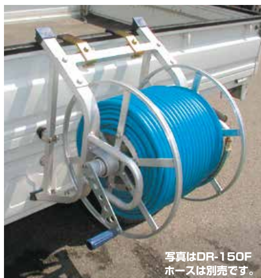
写真はDR-150F ホースは別売です。